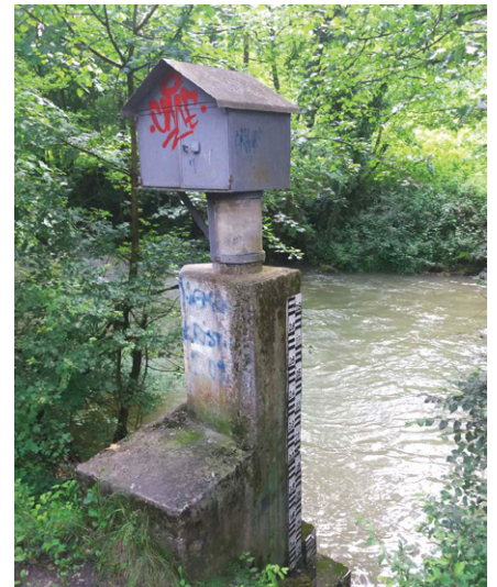
хармонизације висина на 13 мерних станица у сливу реке Колубаре.

Током радова у Општини Коцељева младе колеге угостио је председник Скупштине општине