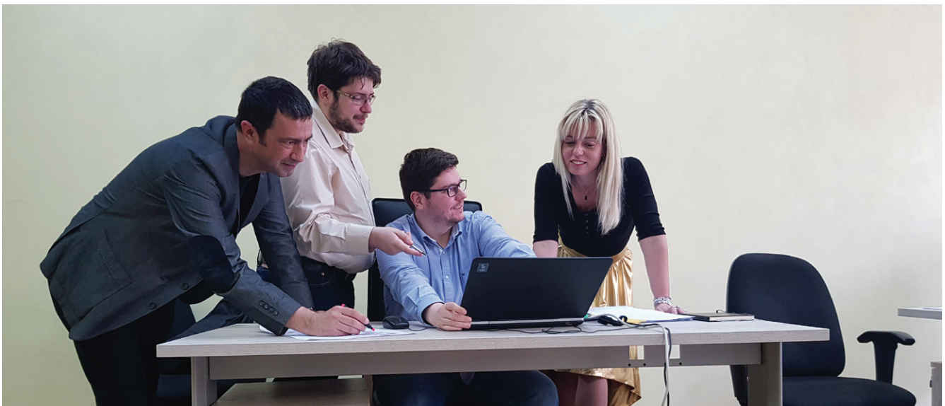
Чланови тима пројекта „Unapređenje poslovne klime u Srbiji“

Републичког геодетског завода у овом послу и подстиће сарадњу са другим државним институцијама и приватним компанијама које производе просторне податке. У овом послу RGZ помажу шведски експерти, који у оквиру пројекта у Србији, пружају подршку изради националног каталога метаподатака, развоју новог геоportала и дефинисању подзаконских аката након ступања на снагу Закона о Националној инфраструктури геопросторних података.